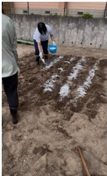
(消毒用の石灰撒き)

出来上がった野菜を、バーベキューでいただけることをみんな(教員も)楽しみにしています！