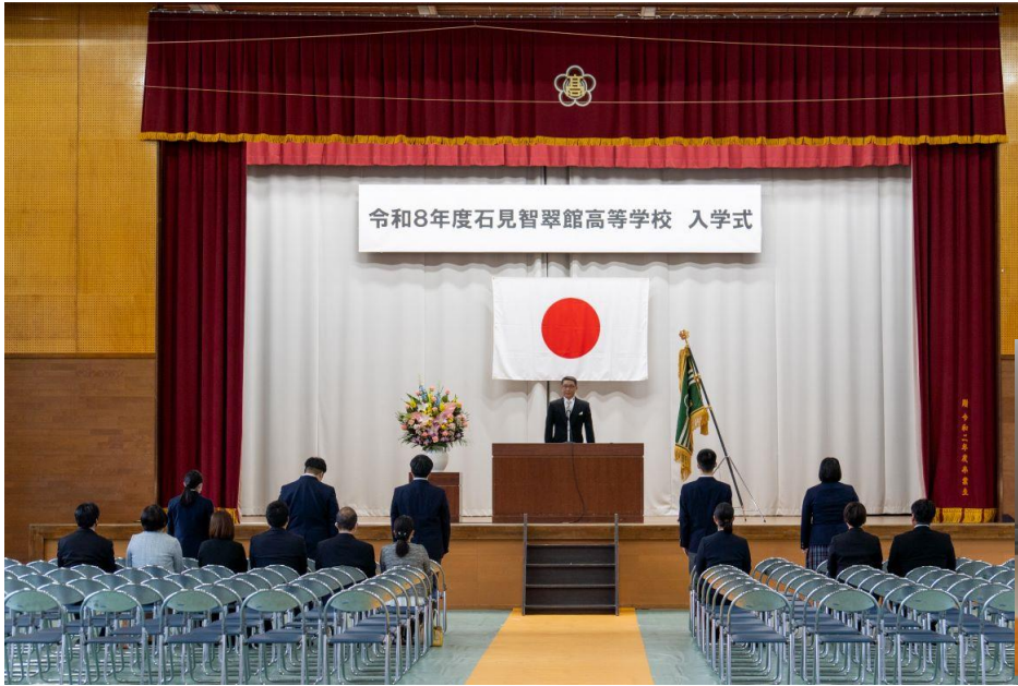
令和8年度石見智翠館高等学校 入学式

今は、学校生活にも少しずつ慣れ、クラスの中の交友関係もできてきたように思います。