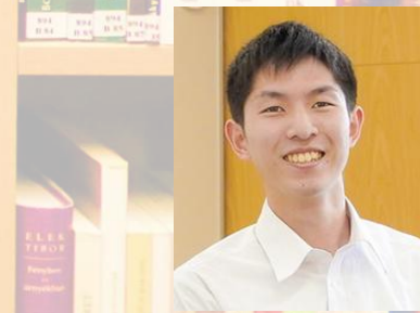
本校屈指の読書家も参戦します!!